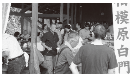
バーベキューパーティー（8月）