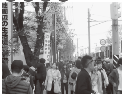
相模原市民さくらまつり（4月または5月）