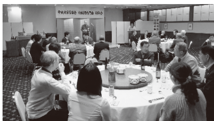
新年会・新春ボウリング大会（1月または2月）