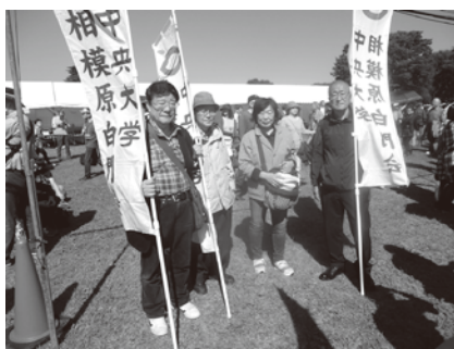
箱根駅伝応援（予選会10月・本大会1月）