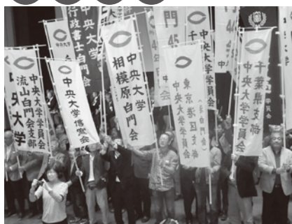
ホームカミングデイ（10月）