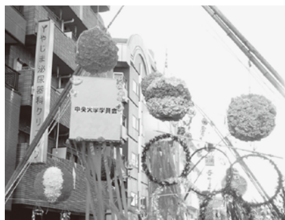
橋本七夕まつり（8月）