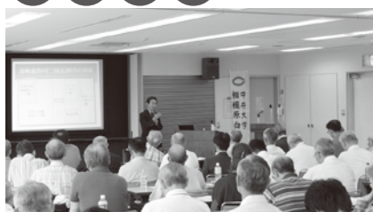
総会・総会記念講演会・懇親会（6月）