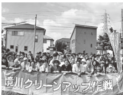
境川クリーンアップ作戦（7月）