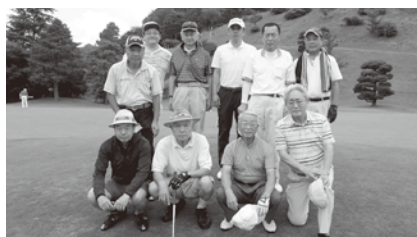
ゴルフコンペ（夏・秋複数回開催）