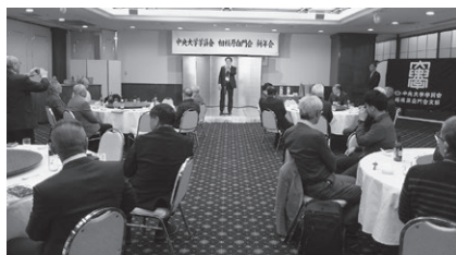
新年会・新春ボウリング大会（1月または2月）