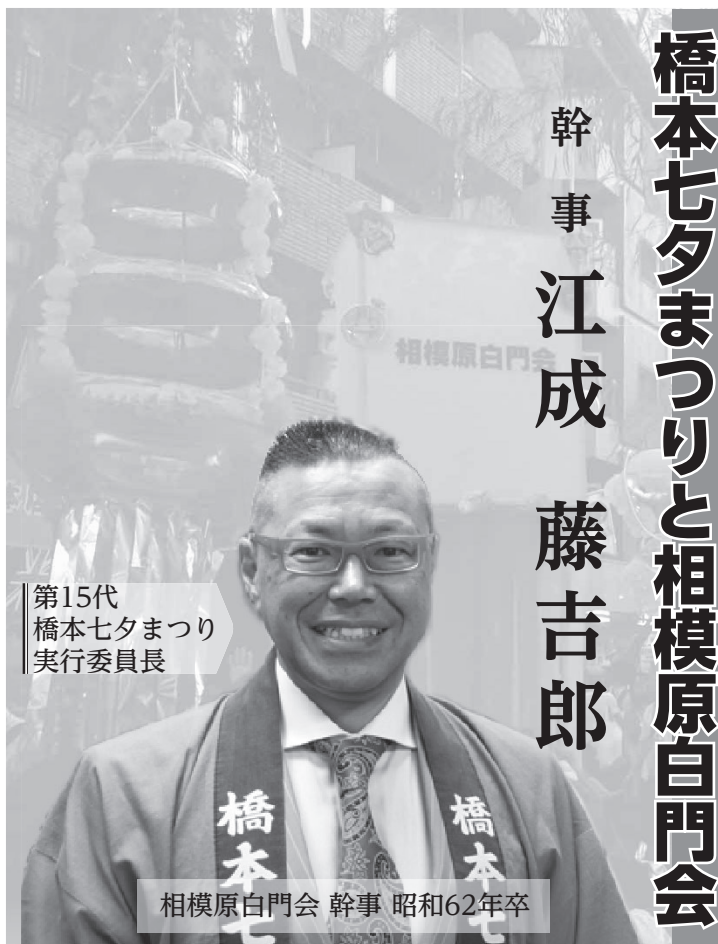
第15代 橋本七夕まつり 実行委員長