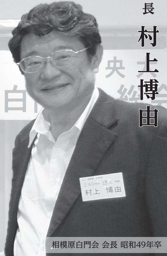
相模原白門会 会長 昭和49年卒

みなさん今日は。コロナの長いトンネルを抜けて、コロナと共存するコロナ後が語られるようになってきました。書面表決が続いた相模原白門会の総会の議事も、今年は何とか総会を開催し顔を合わせて審議することができるようになりました。コロナの状況にもよりますが、駅伝の応援など大学のイベントにも参加できればいいと思っています。