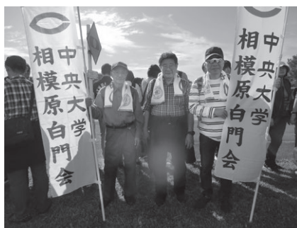
箱根駅伝応援（予選会10月・本大会1月）