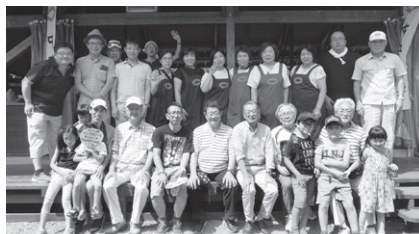
バーベキュー大会（8月）