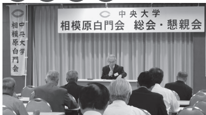
総会・学術講演会・懇親会（6月）