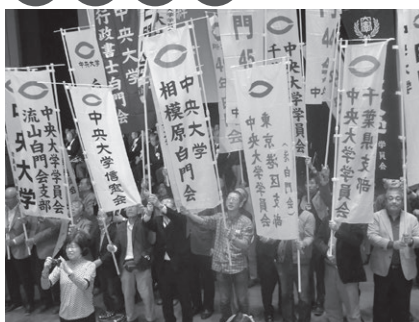
ホームカミングデイ（10月）