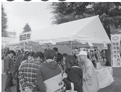
相模原市民さくらまつり（4月または5月）