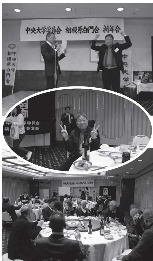
一日も早く新しい形での懇親を深める取組みを増やしてまいりたいと思います！

ージの運用等見直しにより誰にでも簡単にアップデートできる仕様変更にも取組めました。会員の皆さんへの情報提供がタイムリーにできれば、連携の強化に繋がると思います。何れにしても、コロナ禍にありながらも何かしら取組んできた事を大いに役立てて、会員各位間の一層の協力のもと、これからの10年20年を歩んで行けたらと思います。