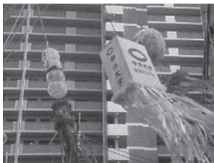
橋本七夕まつり（8月）