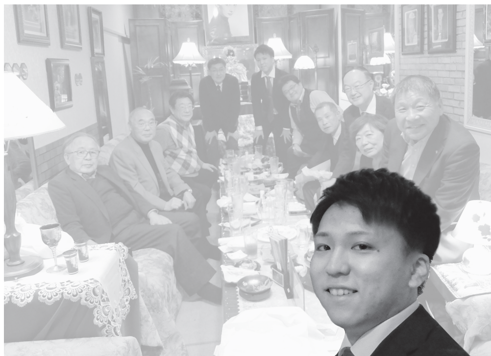
相模原白門会 (相模原支部) 会員 平成30年卒

やはり白門会のような大学OBの皆さんとの集まりは一味違うなど感じました。なぜかというと思ってしまう。代は違えど同じ中央大学で学んだ人と意見を交流させていただくのは不思議と親近感があります。一昔前と今では時代は大きく違いますが、形は多少違えど同じものさしを持っているからこそOB会は楽しくいつもの自分とは少し違う自分が発見できる場所だと思えました。これからもご指導ご鞭撻のほどよろしくお願いいたします。