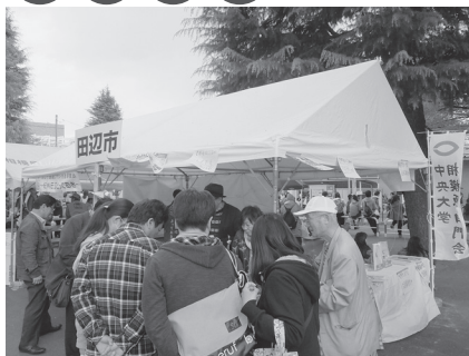
相模原市民さくらまつり (4月または5月)