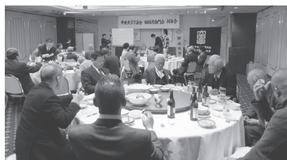
新年会・新春ボウリング大会 (1月または2月)