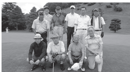
ゴルフコンペ (夏・秋複数回開催)