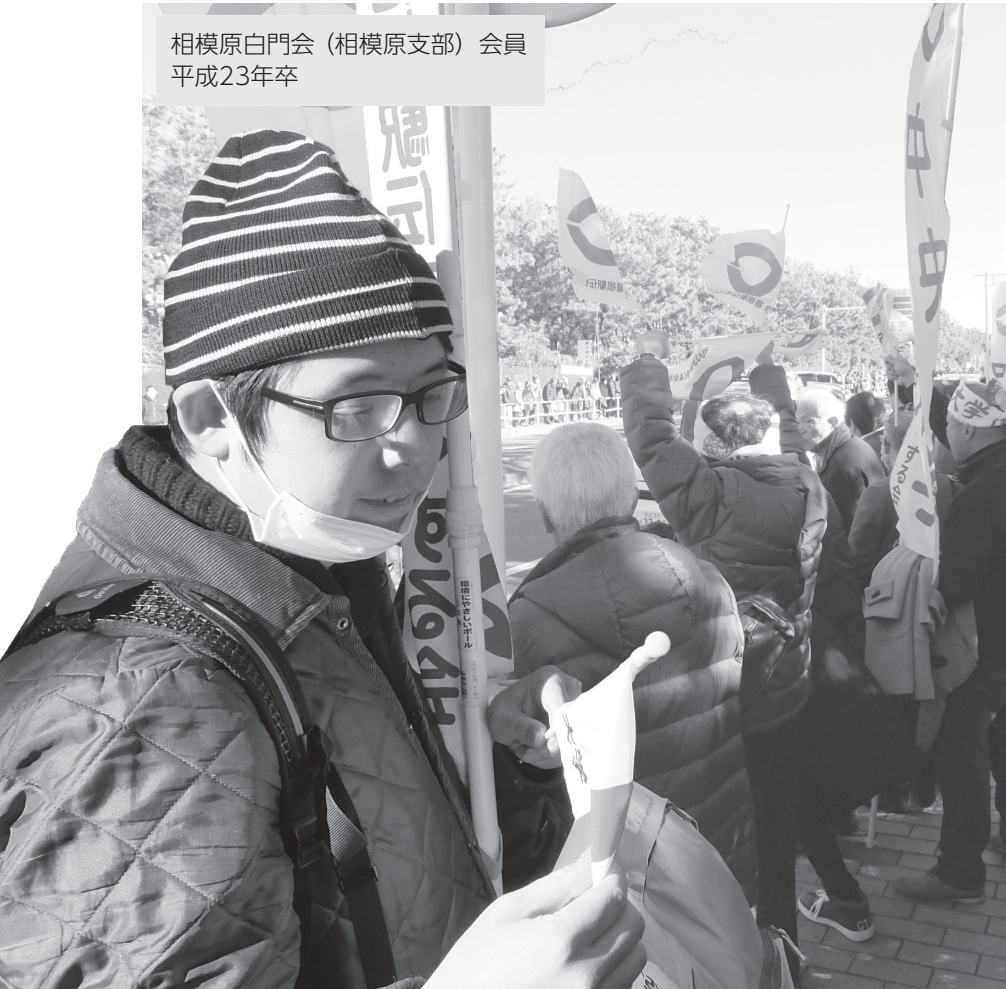
相模原白門会 (相模原支部) 会員 平成23年卒