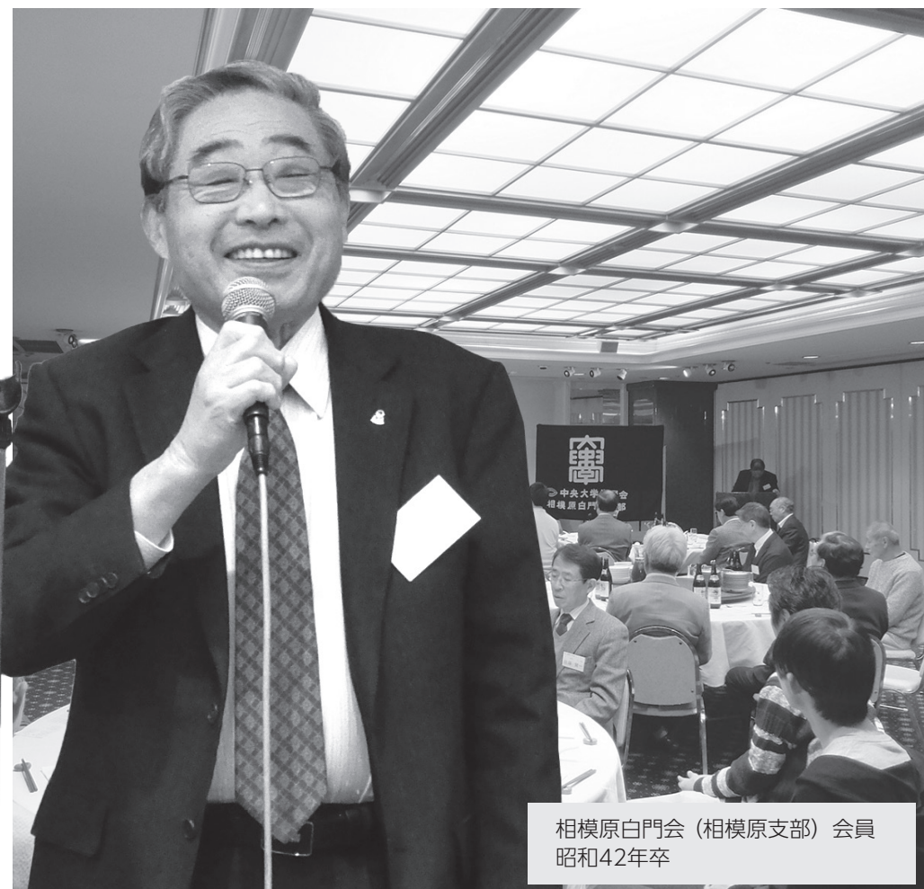
相模原白門会 (相模原支部) 会員 昭和42年卒