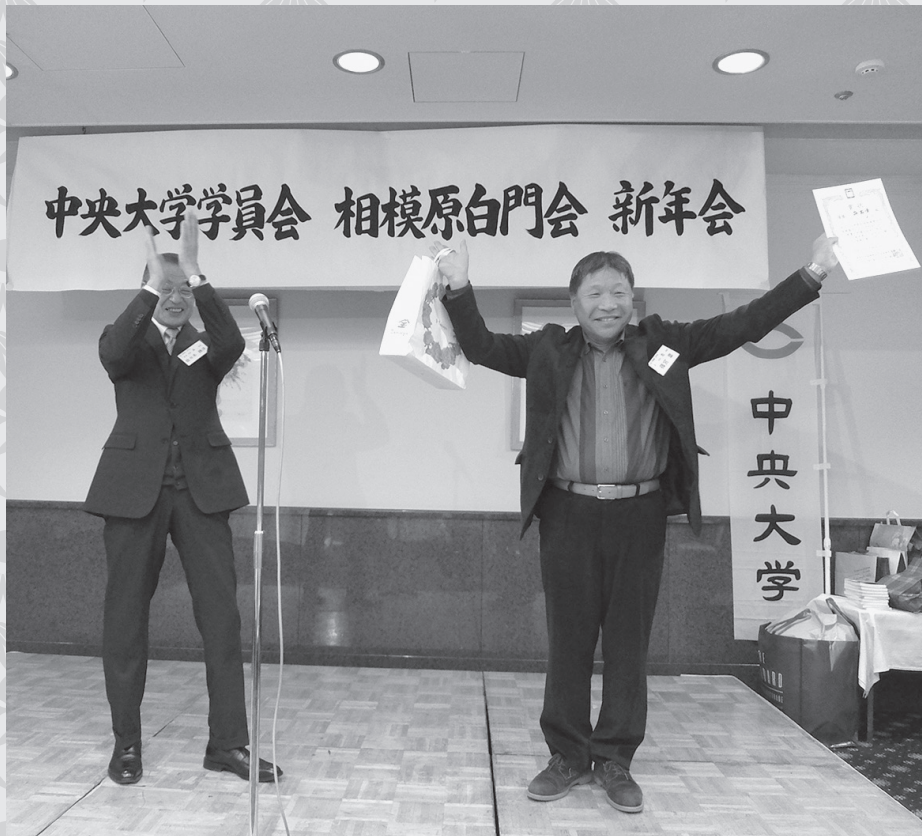
相模原白門会 (相模原支部) 会員 昭和50年卒