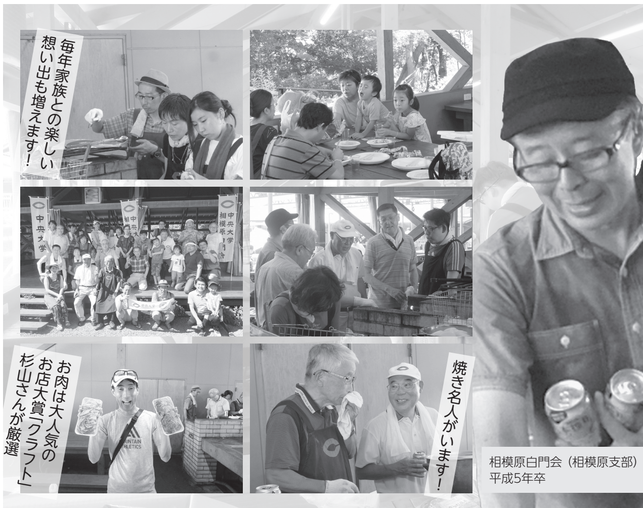
相模原白門会 (相模原支部) 会員 平成5年卒

バーベキュー大会終了後、車に分乗して橋本駅へ向かい、帰路に就きました。参加者の皆様、どうもありがとうございました。