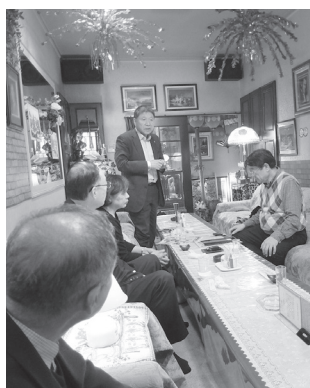
世代を越えた交流が大きな魅力の一つです。

となるとOB会なので大学時代のことから、その後歩んできた人生のこと、仕事のことなどで会が盛り上がりました。