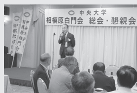
酒井総長は、相模原白門会のメンバーです。