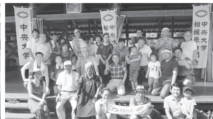
バーベキュー大会 (8月)