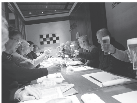
応援の後の懇親会も毎年盛り上がります！

卒業生である私達ができることは何か？それは変化を楽しむことである。だから友よ、大いに叫ぼう、笑おう、飲もう。世代を越えた交わりが在校生に化学変化を齎す。だから、声を出そう「ガンバレ」と。