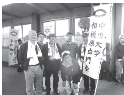
箱根駅伝応援 (予選会10月・本大会1月)