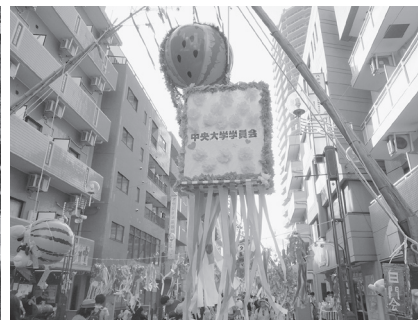
橋本七夕まつり (8月)