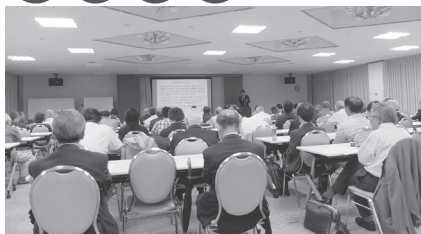
総会・学術講演会・懇親会 (6月)