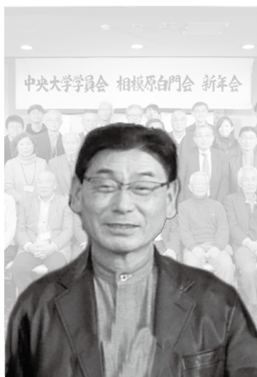
相模原白門会（相模原支部） 昭和47年卒