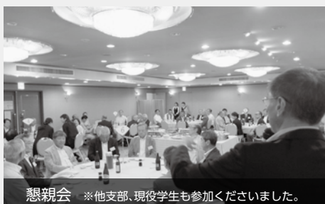
懇親会 ※他支部、現役学生も参加くださいました。