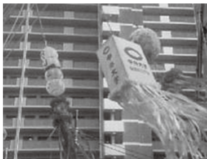
橋本七夕まつり（8月）