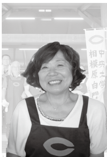
相模原白門会（相模原支部） 昭和44年卒

今年は歴史に残る惨禍に見舞われた。密な会話や場所を避け、外出は自粛。今までは是としていた事が非となってしまう。けれど自然は変わらず、日は昇り、沈み、花は咲く。