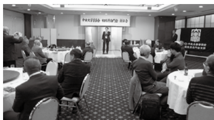
新年会・新春ボウリング大会（1月または2月）