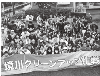
境川クリーンアップ作戦（5~7月頃）