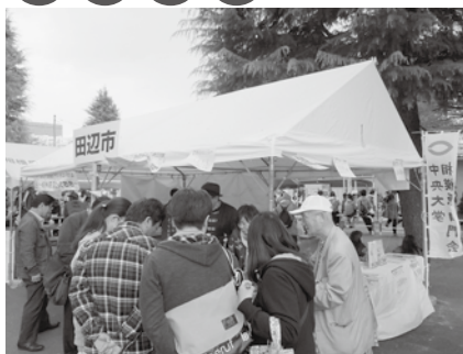
相模原市民さくらまつり（4月または5月）