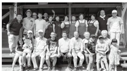
バーベキュー大会（8月）