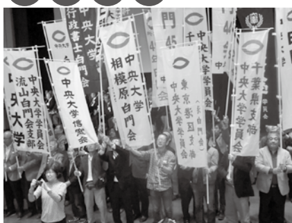
ホームカミングデイ（10月）