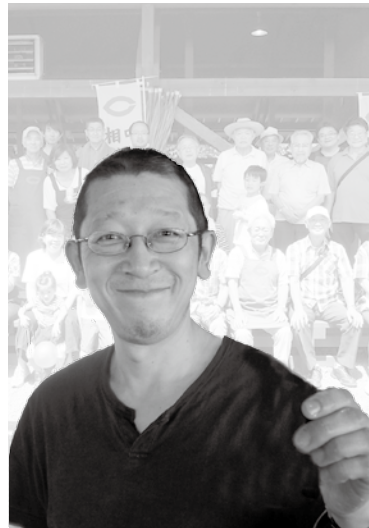
相模原白門会 (相模原支部) 平成7年卒

「白門会なんかおやじばっかりだし、仕事を押し付けられてつまらないよ。」他地域で役員をやっていた友人はこぼしていた。