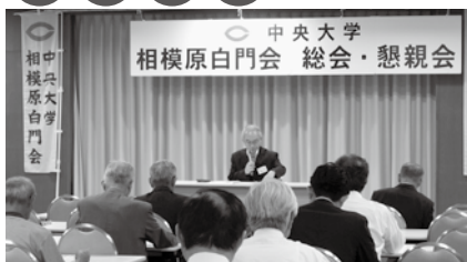
総会・学術講演会・懇親会（6月）