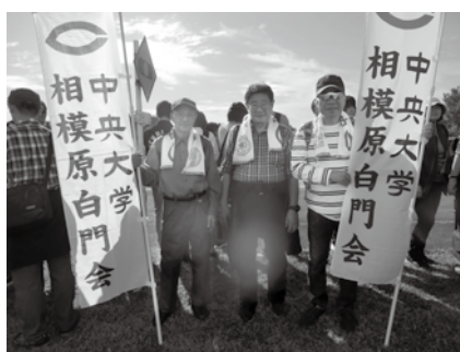
箱根駅伝応援（予選会10月・本大会1月）