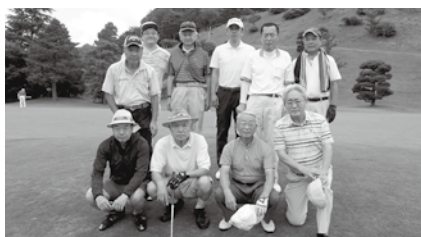
ゴルフコンペ（不定期開催）