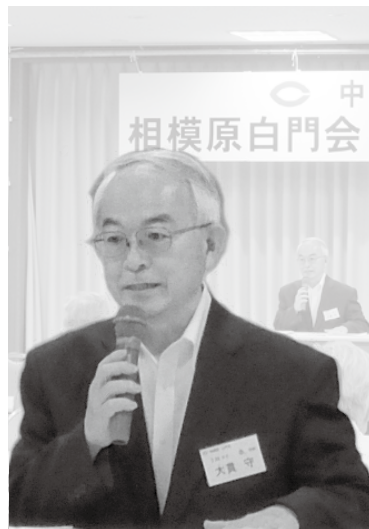
相模原白門会 (相模原支部) 昭和52年卒

市役所を定年退職した後、嘱託職員としての5年間の勤務を終え、この4月からは、特別養護老人ホームの非常勤の事務長として戸惑いの多い日々を送っています。